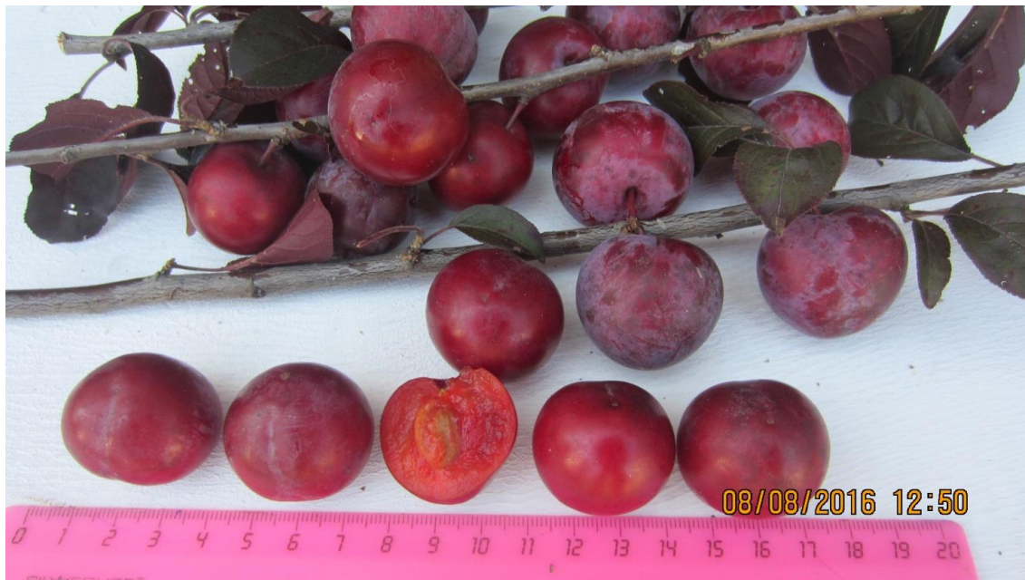
Рисунок 2 – Побеги и плоды сорта Приморочка

Плоды овальные, средние (средняя масса 22,0 г, максимальная – 25,0 г), высота 20 мм, средней одномерности. Вершина плода округлая, воронка широкая (рисунок 2). Основание плода с углублением, ямка средняя. Брюшной шов средней глубины. Плодоножка средняя, легко отделяется от ветки, прикрепление к косточке прочное.