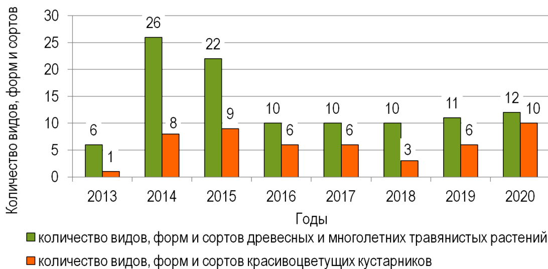
Рисунок 3 – Динамика пополнения коллекции дендрария ВНИИСПК новыми видами, формами и сортами растений (2013...2020 гг.)