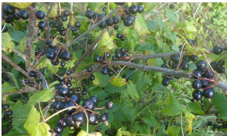
Рисунок 2 – Многочлестность узлов у сорта Очарование