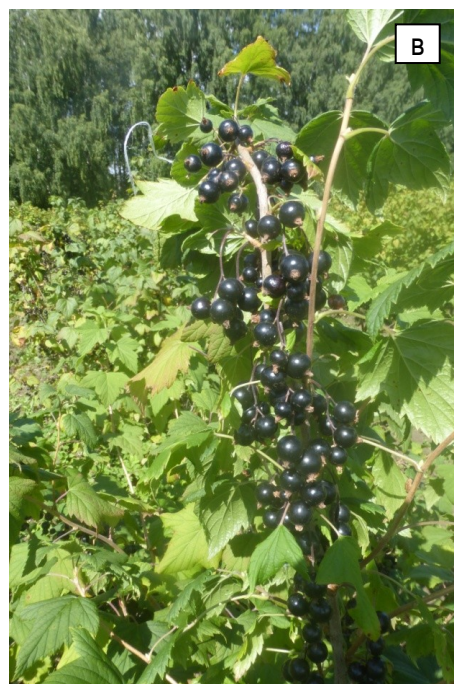
а) Орловский вальс, б) Грация, в) Муравушка Рисунок 3 – Плодоношение сортов черной смородины