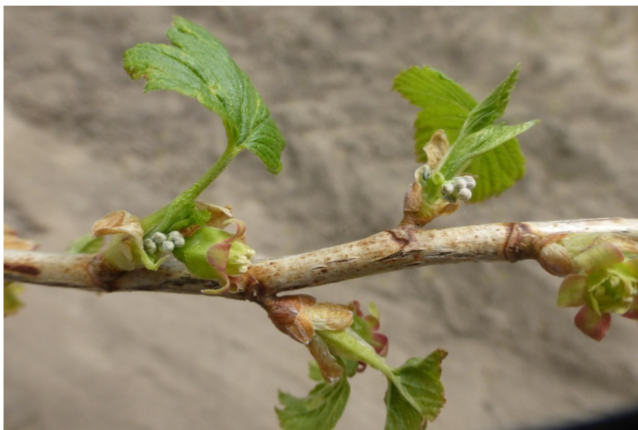
Рисунок 1 – Подмерзание генеративных органов после весенних заморозков сорта Грация

Другим типом зимних повреждений являются возвратные весенние заморозки. Весной 2017 года, после внезапного резкого похолодания во время вегетации растений, подмерзли кончики молодых распускающихся листочков у большинства изученных образцов, хотя к ощутимым последствиям для растений это не привело. При наступлении второй волны холодов, продолжавшейся довольно длительное время (в течение первой и второй декады мая температура воздуха держалась на уровне 1,2...6,8°C) произошло подмерзание бутонов в выдвигающихся кистях у ряда образцов. В особенной степени это коснулось сортов Грация (рисунок 1) и Кипиана, у которых наблюдалось подмерзание от 80 до 90% бутонов, что негативным образом сказалось на продуктивности растений в текущем году. У сорта Гамма было повреждено до 60...65% бутонов. Единичные повреждения бутонов и цветков отмечены у сортов Арапка, Дачница, Монисто, Орловская серенада, Орловский вальс. Не имели повреждений сорта Ажурная, Блакестон, Десертная Огольцовой, Монисто, Муравушка, Очарование, Чудное мгновение и 2780-20-33 (Тихонова, 2018).