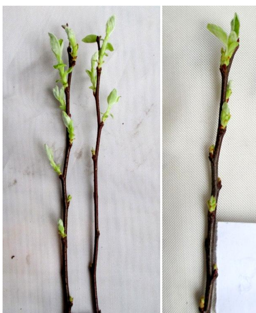
Рисунок 2 – Отрастание почек у формы 32А-1-24 после искусственного промораживания однолентного прироста при температуре -30^{\circ}\text{C} (1 компонент); слева – исследуемые образцы (2 шт), справа – контроль (1 шт)

При понижении температуры до -40^{\circ}\text{C} (2 компонент) повреждение почек составило от 4,3 баллов у форм 32А-1-9 до 4,9 балла у формы 32А-1-35 (таблица 3). Отрастание почек у всех форм полностью отсутствовало (рисунок 3).