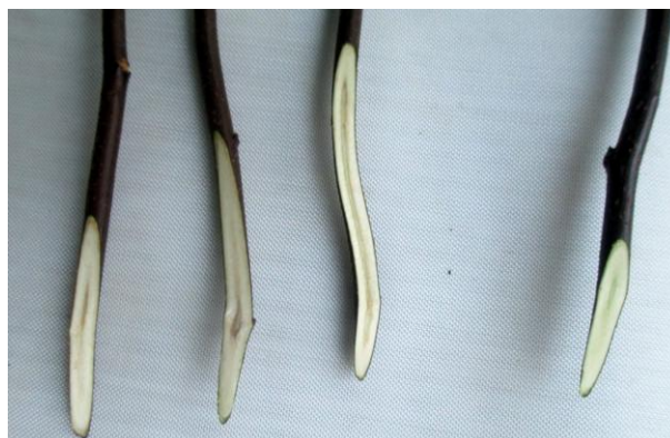
Рисунок 5 – Степень повреждения однолетнего прироста форм айвы (форма 32A-1-30) после промораживания при температуре -25°C – 3 компонент. Слева 3 побега подвергшиеся воздействию температуры, справа – контрольный побег

Повреждение древесины было незначительным, наблюдалось у всех форм и варьировало от 1,7 балла (32A-1-24) до 2,4 баллов (32A-1-26).