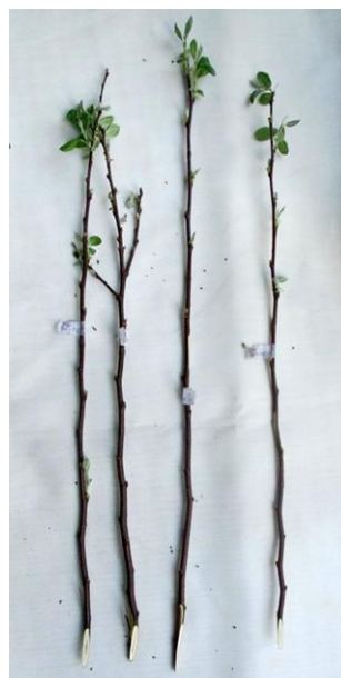
Рисунок 6 – Отрастание почек у формы 32A-1-26 после искусственного промораживания однолетнего прироста при температуре -25°C (3 компонент); слева – исследуемые образцы (3 шт), справа – контроль (1 шт).

Повреждение коры изменялось от 1,8 баллов (32A-1-30) до 2,2 балла (32A-1-29) (рисунок 6).