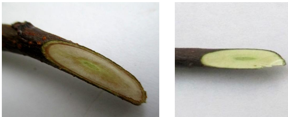
Рисунок 1 – Повреждения формы 32А-1-35 после промораживания при температуре минус -30^{\circ}\text{C} (1 компонент). Слева исследуемый образец, справа контроль