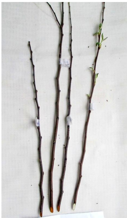
Рисунок 4 – Отрастание почек у формы 32А-1-30 после искусственного промораживания однолетнего прироста при температуре -40^{\circ}\text{C} (2 компонент); слева – исследуемые образцы (3 шт), справа – контроль (1 шт).

При исследовании стабильной морозостойкости (3 компонент – -25^{\circ}\text{C} ) наибольшее повреждение почек составило 2,1 балла у форм 32А-1-9 и 32А-1-26, а наименьшее у форм 32А-1-24 – 1,8 балла (таблица 4). При этом большая часть почек нормально отрастала (рисунок 5). Разница между степенью повреждения у форм были несущественны ( F_{ф} < F_{т} ).