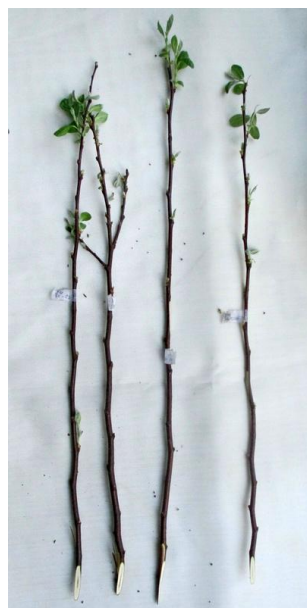
Рисунок 6 – Отрастание почек у формы 32A-1-26 после искусственного промораживания однолетнего прироста при температуре -25°C (3 компонент); слева – исследуемые образцы (3 шт), справа – контроль (1 шт).

Повреждение коры изменялось от 1,8 баллов (32A-1-30) до 2,2 балла (32A-1-29) (рисунок 6).