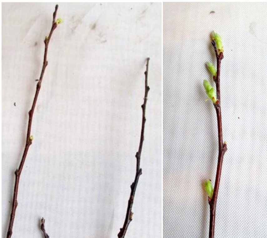
Рисунок 8 – Отрастание почек у формы 32А-1-35 после искусственного промораживания однолетнего прироста при температуре -35^{\circ}\text{C} (4 компонент); слева – исследуемые образцы (2 шт), справа – контроль (1 шт)