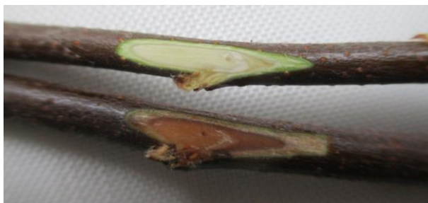
Рисунок 3 – Степень повреждения однолетних побегов айвы после промораживания при температуре -40^{\circ}\text{C} (2 компонент). Внизу исследуемый образец, вверху контроль

Таким образом, способность растений выдерживать максимальную морозостойкость (2 компонент), оказалась критической при температуре -40^{\circ}\text{C} . Все побеги получили значительные повреждения, почки не распускались. Разница между исследуемыми формами оказалась несущественной.