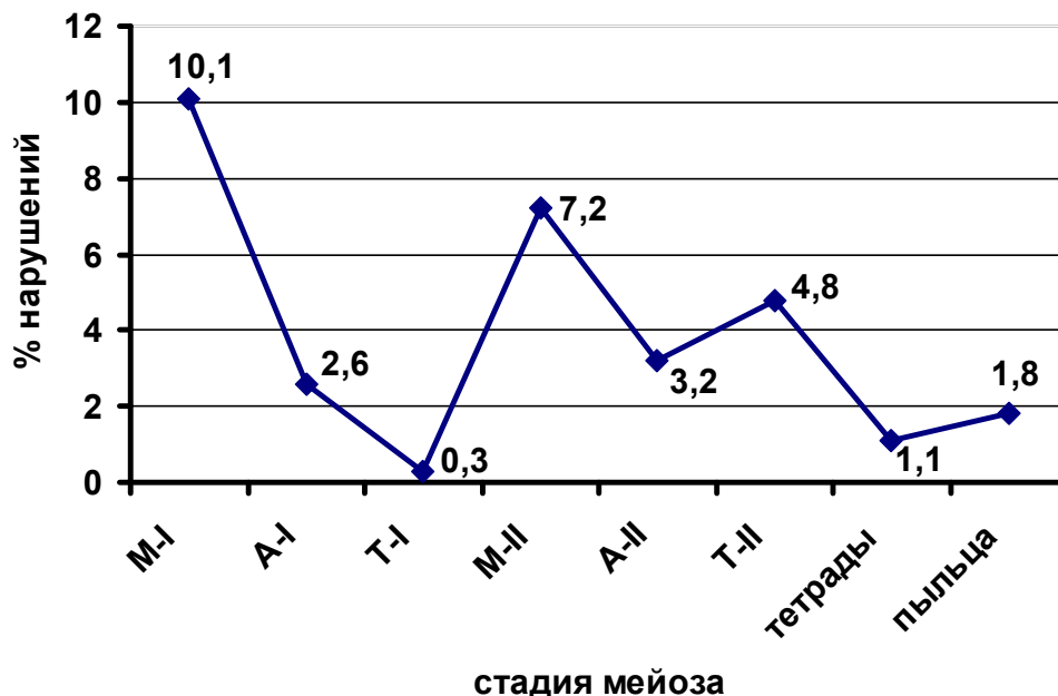
Рисунок 2 – Ход мейоза при микроспорогенезе у колонновидной формы яблони Восторг

следующий максимум приходится на стадию метафаза-II – 7,2%, затем на стадию телофаза-II – 4,8%. К моменту завершения мейоза число нарушений заметно снижается.